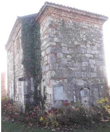
San Vittore (e Corona): abside e fianco destro

Recuperando l'auto ci si dirige al piccolo cimitero del paese, dove si erge la chiesa di San Vittore (e Corona) del XII secolo: del periodo romanico conserva solo parte dei materiali da costruzione.