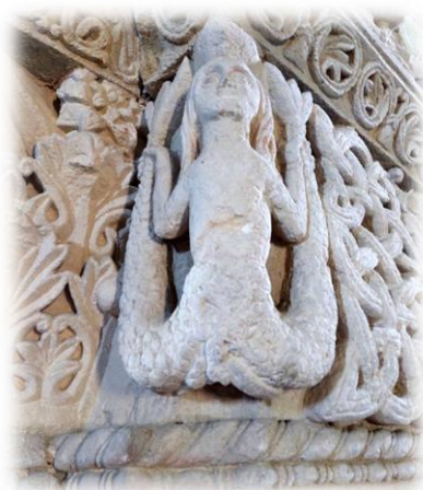
Sirena bicaudata nella Pieve di San Lorenzo a Montiglio Monferrato