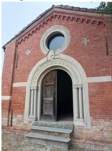
Santi Sebastiano e Fabiano

Lungo la SP2, sulla sommità della collina che precede il borgo, sorge la pieve